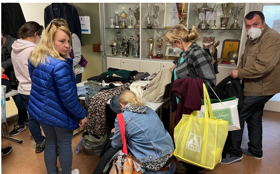
Die Kleiderspenden wurden nicht gerade wie „warme Semmeln“ angenommen.

Die Flüchtlinge dürfen erstmal ein Jahr hier bleiben, wahrscheinlich sogar bis zu 3 Jahren. Ein Asyl Antrag ist daher nicht vonnöten.