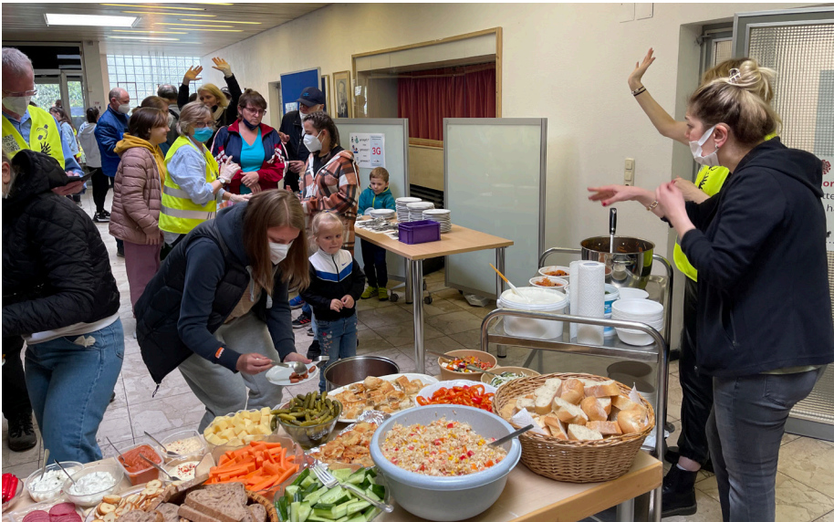
Beim 1. Info-Treff für ukrainische Flüchtlinge spendeten die Helfenden und DGS-Studierenden selbst gemachtes Essen für alle ukrainischen Flüchtlinge. Mit Hilfe einiger ukrainischen Frauen wurde die einheimische Nationalsuppe Borschtsch gekocht.

Der schreckliche Angriffskrieg der Russen auf die Ukraine dauert immer noch an. Viele Ukrainer*innen mussten ihre Heimat verlassen, um sich in Sicherheit zu bringen. Darunter auch viele taube Menschen. Aktuell befinden sich ca. 160 taube Ukrainer*innen – oder ukrainische Hamburger*innen? in Hamburg.