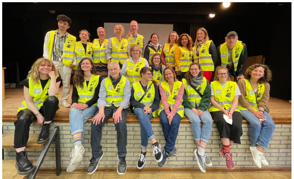
Die erste Gruppe von Helfenden mit gelben Westen

Die Flüchtlinge, die direkt von Freiwilligen/ Familien aufgenommen worden sind, müssen sich nicht bei der ZEA anmelden, es sei denn, sie benötigen medizinische Hilfe. Alle medizinischen Hilfen werden von der ZEA koordiniert. Der Rote Kreuz ist auch dort ansässig. Die händigen auch vorläufige Krankenkassenkarten aus für Arztbesuche ect. Die Flüchtlinge, die direkt in Familien aufgenommen wurden, melden sich direkt bei der Ausländerbehörde an. Die Flüchtlinge können auch den HVV kostenlos nutzen, vorausgesetzt, sie haben ihren Pass dabei.