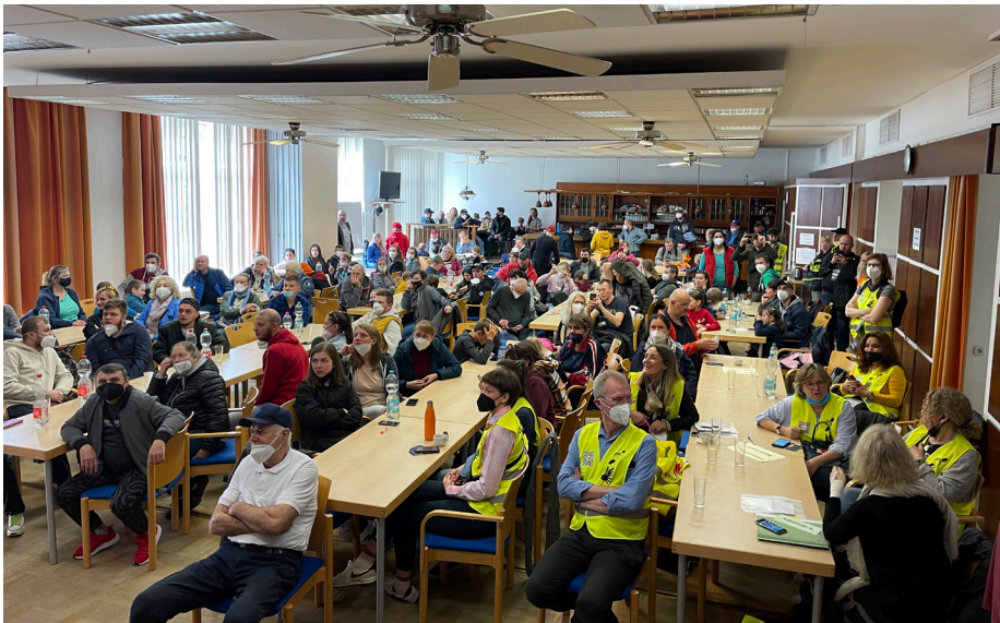
Voller Informationstreff für Flüchtlinge und Helfende am 8. März 2022

impft. Für die Datenaufnahme werden Dolmetscher benötigt, die russisch oder ukrainisch können.